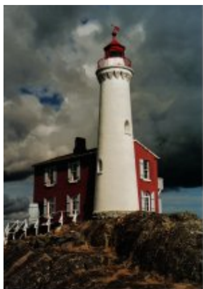
Fisgard Lighthouse bei Victoria

"Von Natur aus spektakulär" heißt der Werbeslogan der Stadt und dieser ist dank der herrlichen Kulisse der Küstengebirge auf der einen Seite sowie des Pazifiks auf der anderen Seite nicht übertrieben. Kanadas drittgrößte Stadt mit ihrem multikulturellen Zentrum, geprägt vor allem durch die chinesischen Einwanderer, gilt als eine der schönsten der Welt. Seit der Weltausstellung 1986 - gleichzeitig der 100. Geburtstag der Stadt - haben dies auch die Touristen erkannt.