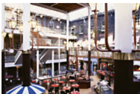
Dublin, Powers Court Shopping Centre

70 Prozent der Fläche Irlands werden landwirtschaftlich genutzt. Hier wird vor allem Milchwirtschaft und Rinderzucht sowie Schafzucht betrieben. Im Ackerbau werden Gerste, Weizen, Zuckerrüben und Kartoffeln angebaut. Auffällig ist im Bereich der Energiewirtschaft die Verwendung von Torf, der fast in ganz Irland gestochen wird. Heute wird jedoch verstärkt zur Stromerzeugung auf Wasserkraft umgestellt.