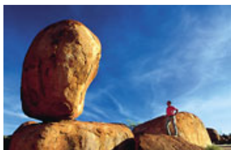
Devil's Marbles, NT

Die Region reicht von der Wüste im Zentrum des Landes (Red Center) bis an die Küste und die vorgelagerten Inseln des tropischen Nordens, dem Top End. Hauptanziehungspunkte für Touristen sind die mysteriösen Formen der Wüste wie etwa Ayers Rock und der Kakadu National Park mit seiner einzigartigen Wildnis und seinem Tierleben.