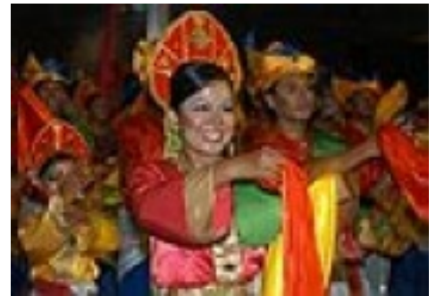
Tänzerin beim Colours of Malaysia Festival

wohner, Metro Kuala Lumpur etwa 7,2 Millionen Einwohner. Die Bevölkerung besteht zu 52 Prozent aus Chinesen, zu 39 Prozent aus Malaien und zu 6 Prozent aus Indern. Daneben leben Araber, Sri Lanker, Europäer, Indonesier und Philippiner in Kuala Lumpur.