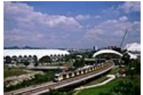
Light Rail Transit (LRT)

220/240 Volt Wechselstrom, 50 Hertz. Ein Adapterstecker ist notwendig, der in großen Hotels auch an der Rezeption geliehen werden kann.